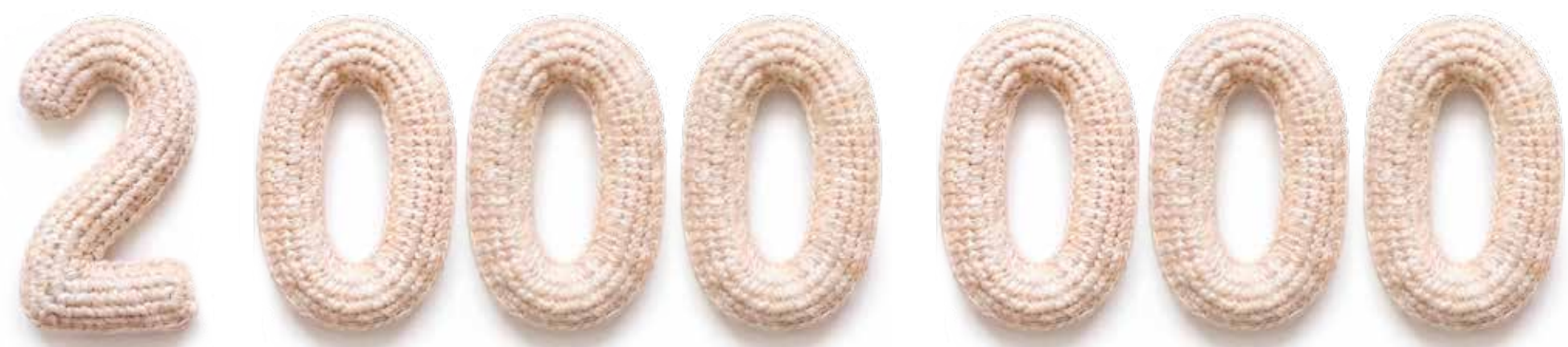
unikátních zobrazení na sociálních sítích